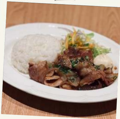
生姜焼きプレート ¥1300