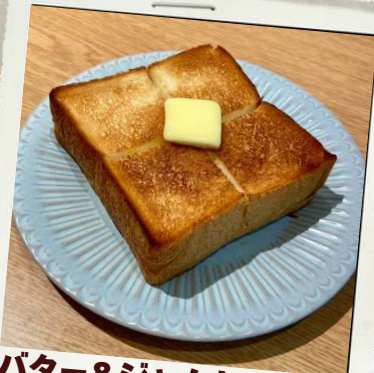
バター&ジャムトースト ¥550 はちみつ&シナモントースト ¥650