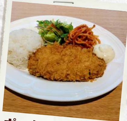
ポークカツプレート ¥1600