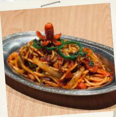
懐かしナポリタン ¥1400